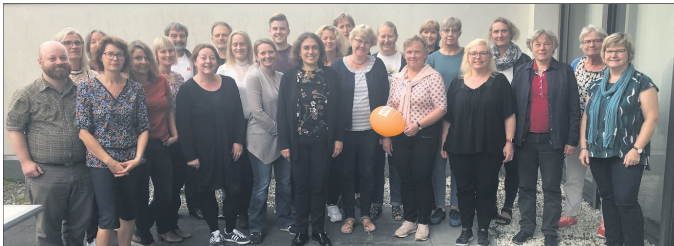
Deltagerne ved årets tyskkursus i Lüneburg