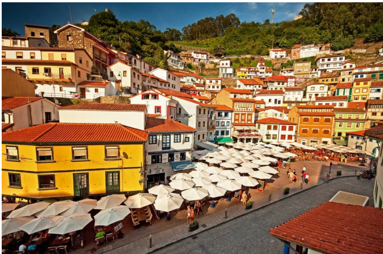
Nices gamle bydel