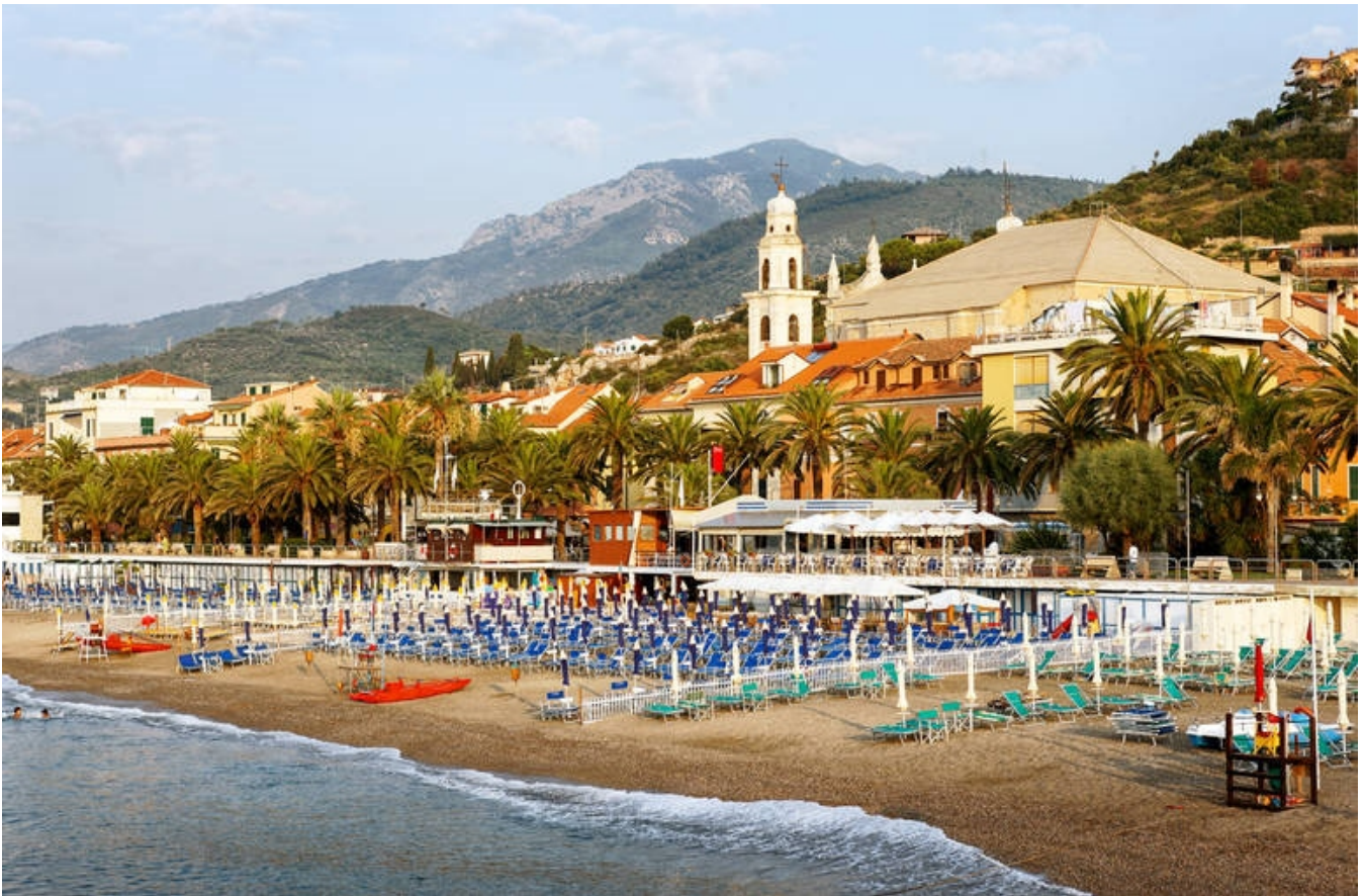
Stranden i Pietra Ligure

den regionale linguinipasta. Området er også mestre i småkager, olivenolie og retter med sardiner og ansjoser. Den lokale hvidvin fra Cinque Terre-området kan også anbefales.