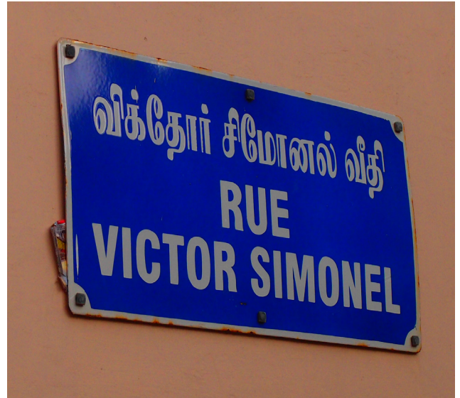
Tv. og th. I den gamle franske bydel i Pondicherry er der stadig franske gadeskilte