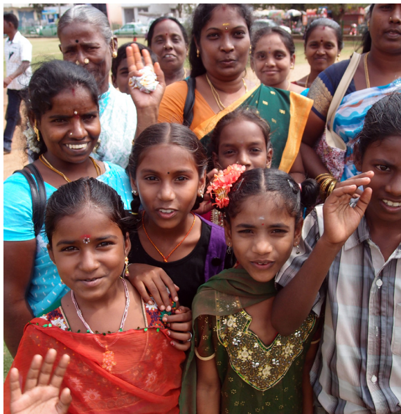
Tv. Skoleklasse på tur ved klippereliefferne i Mahabalipuram Th. Fiskerbåde på Koromandelkysten