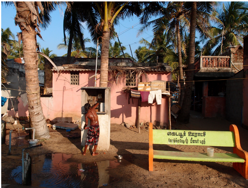
På vores tuk-tuk-safari besøger vi et af de små fiskersamfund på Koromandelkysten