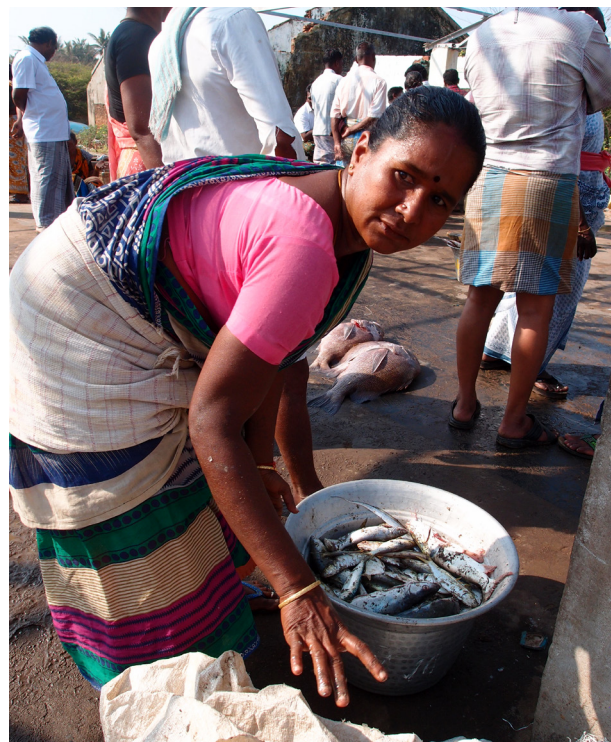
Tv. Et af de 12 gompuras (tårne) i tempelkomplekset Meenakshi Amman i Madurai Th. Kvinde sælger dagens fangst på fiskemarkedet i Trankebar