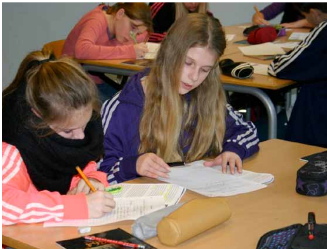
Man tager notater for at fastholde det vigtigste i en tekst. Man ordner sine notater i overordnede og underordnede informationer for at danne sig et overblik over emnet. 6.a arbejder her med to-kolonne-notater.