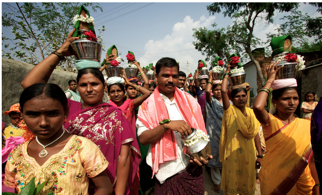
Lokale hinduer i religiøst optog for guden Hanuman