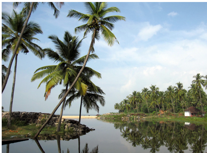
Tv. De gamle, kinesiske fiskernet i den historiske by Fort Kochi er stadig i brug Th I Kerala er der palmer så langt øjet rækker.