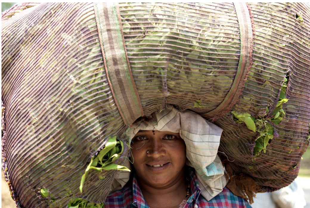
Teplukker med dagens høst. Det er primært kvinder, som arbejder i Sydindiens mange teplantager

Vi hører om arbejdet i Island Trust og hilser på nogle af de børn, som er kommet i skole takket være organisationens indsats.